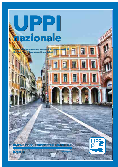
Treviso - Piazza dei Signori